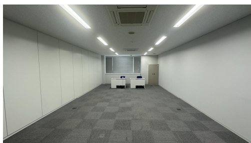
8 号室(5 8 m 2 )