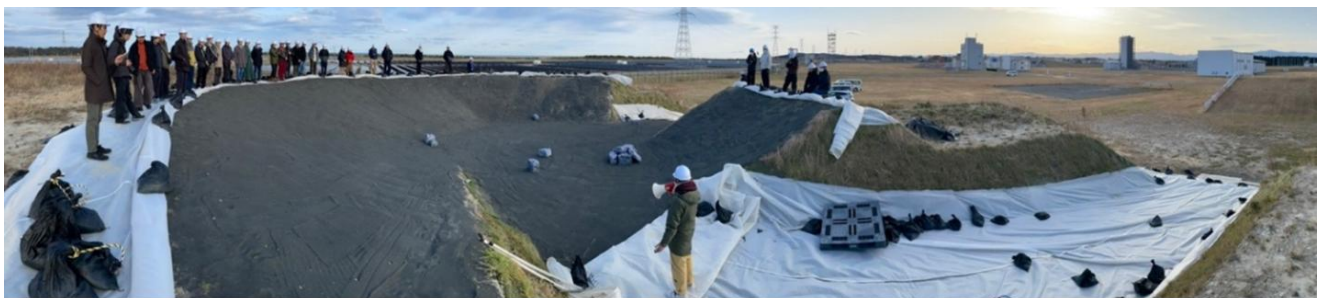
見学者への説明の様子

本共同実証の結果は、それぞれが運営する web サイトや SNS 等にて広く公開する予定である。今後も三者の関係を維持し、同様の活動を継続することで東北エリアの宇宙開発を支える取り組みとしていきたい。