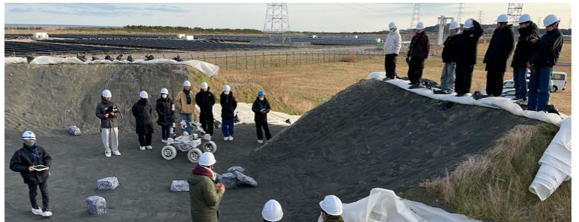
「惑星探査模擬ミッション」の様子